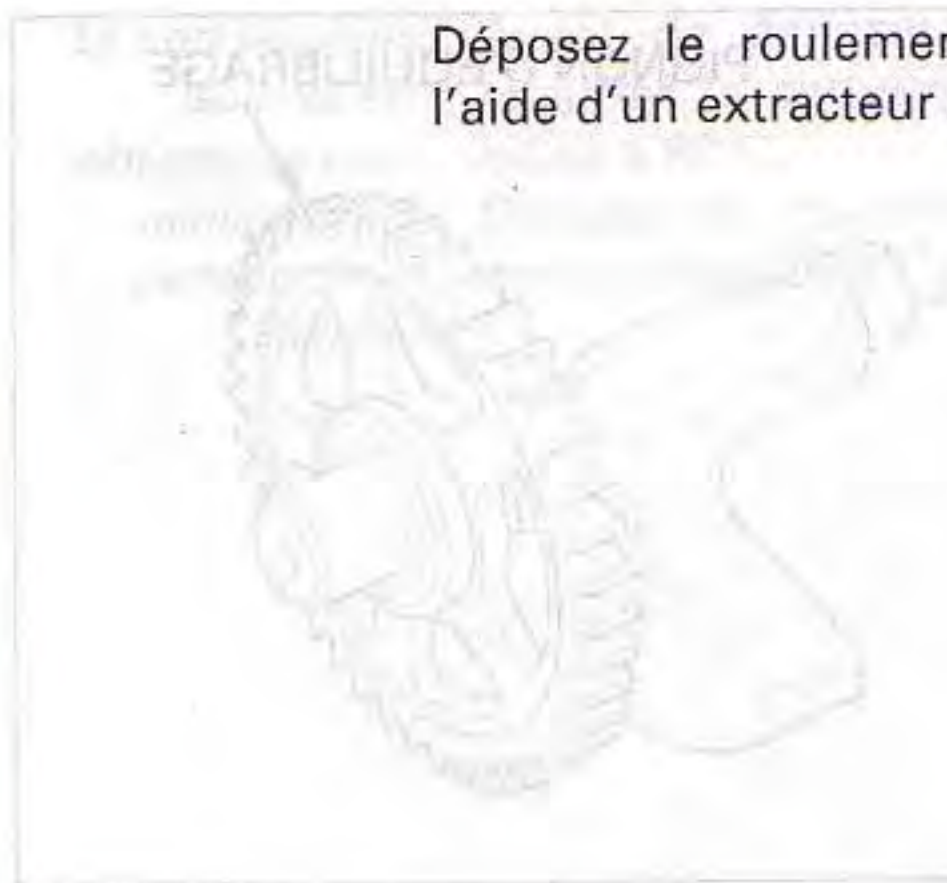
EXTRACTEUR DE ROULEMENT UNIVERSEL DISPONIBLE DANS LE COMMERCE

Déposez le roulement de demi-carter gauche à l'aide d'un extracteur de roulement.