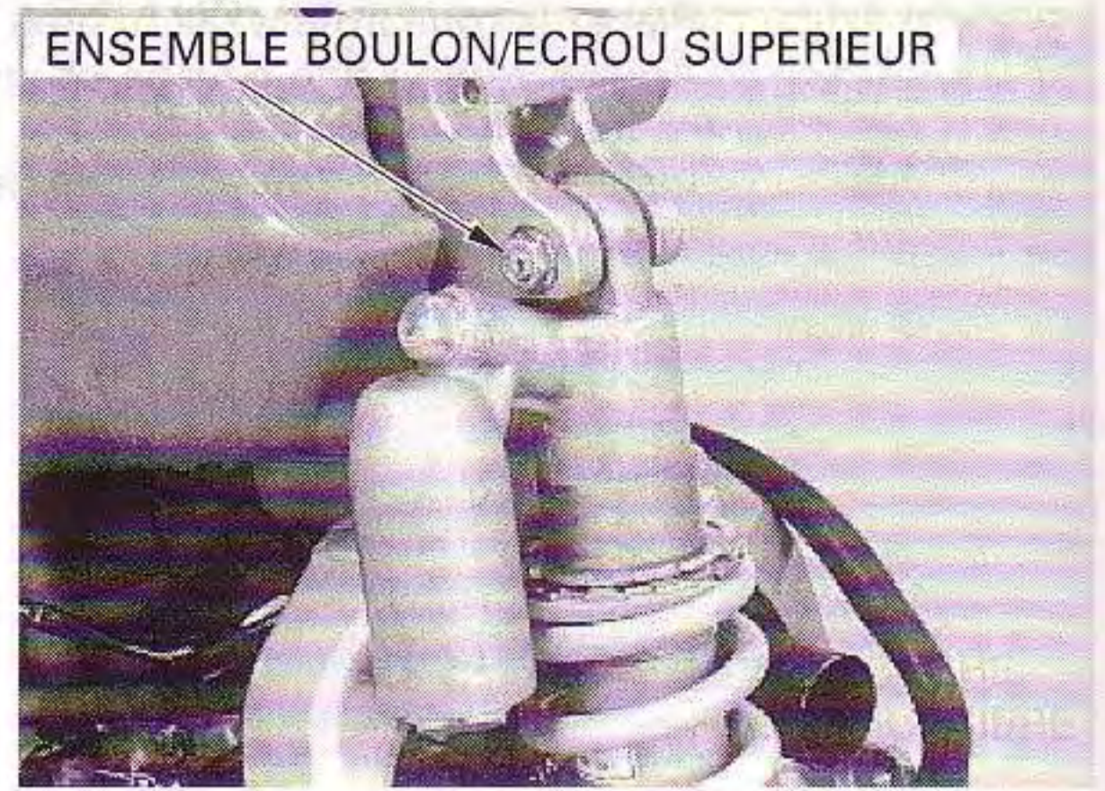
ENSEMBLE BOULON/ECROU SUPERIEUR

Déposez l'ensemble boulon/écrou de fixation supérieure et l'amortisseur.