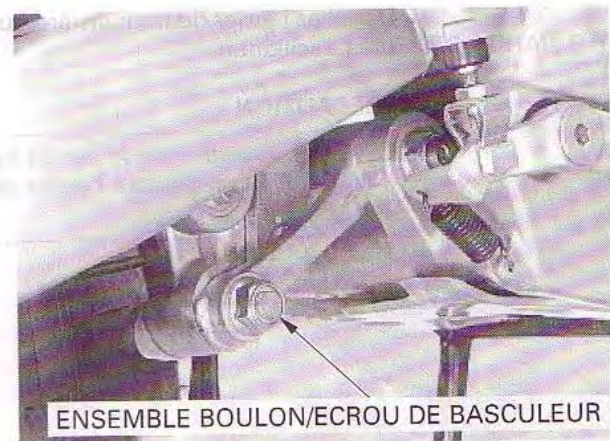
ENSEMBLE BOULON/ECROU DE BASCULEUR

Installez la béquille latérale et les boulons. Serrez les boulons au couple spécifié.