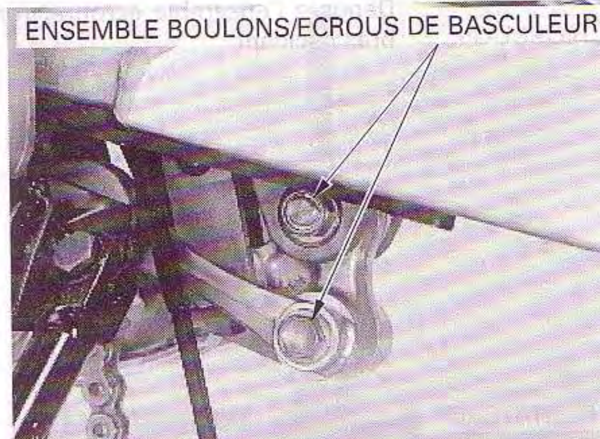
ENSEMBLE BOULONS/ECROUS DE BASCULEUR

Déposez les boulons et les écrous du basculeur (côté bras oscillant, côté biellette).