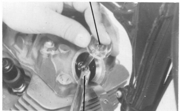
CHAVE DE VÁLVULAS 8 x 9 mm