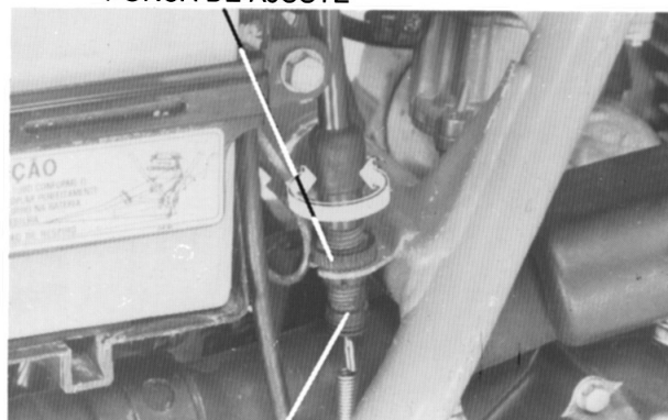
INTERRUPTOR DA LUZ DO FREIO TRASEIRO