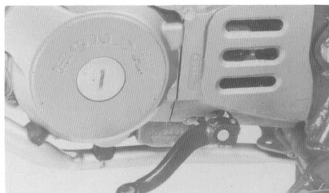
(2) O número de série do motor está gravado na parte inferior da carcaça esquerda do motor.