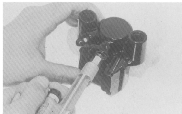
PINOS DE ARTICULAÇÃO