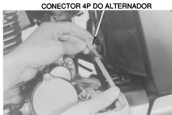
CONECTOR 4P DO ALTERNADOR

Substitua o estator caso a resistência esteja em desacordo a especificação ou se houver continuidade entre um dos terminais e o terra.