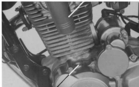
TAMPA DE VERIFICAÇÃO