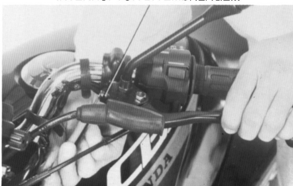
INTERRUPTOR DA EMBREAGEM

EMBREAGEM ACIONADA: CONTINUIDADE EMBREAGEM SOLTA: SEM CONTINUIDADE